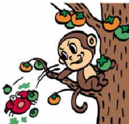
日本昔話「さるかに合戦」