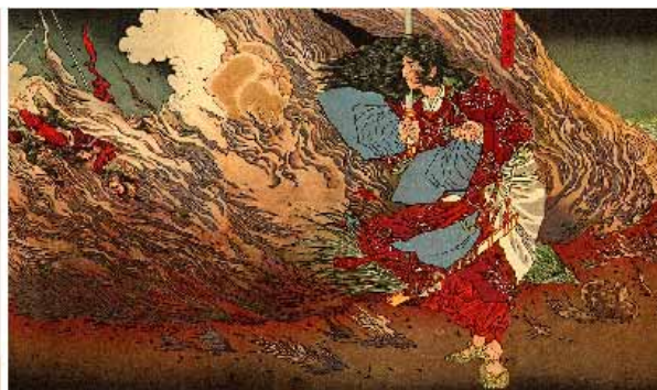
草薙剣(天叢雲剣)伝説