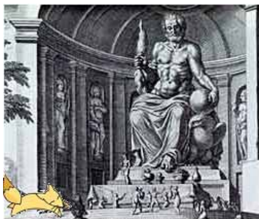
イソップ寓話「ゼウスと狐」